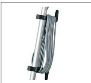
✓ 15m Kabel mit Kabelhalter