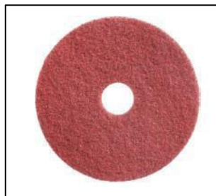
✓ Große Auswahl an Pads