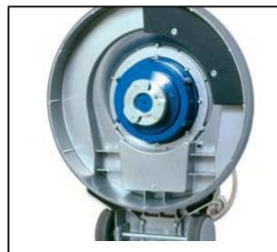
✓ Planetengetrieb Edelstahl